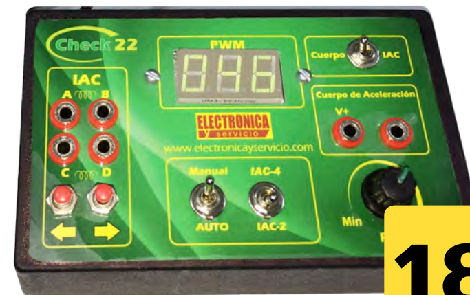
Probador de cuerpo de aceleración y válvulas IAC