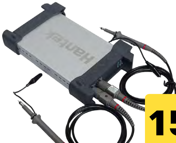
Osciloscopio 20 MHz, 2 canales