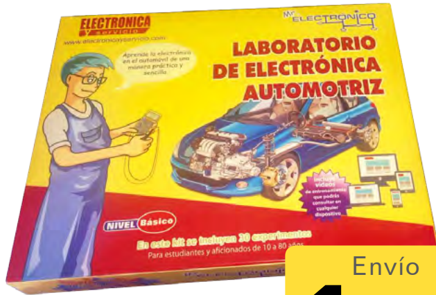
Mr. Electrónico Automotriz