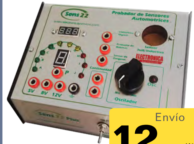
Probador de sensores